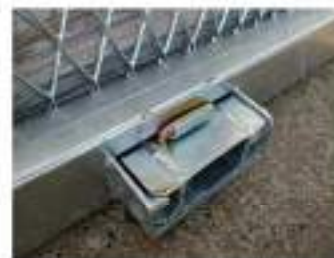
③:ツメ抜け止めストッパー