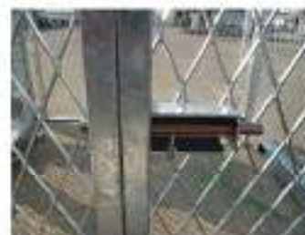
②:開き止めストッパー