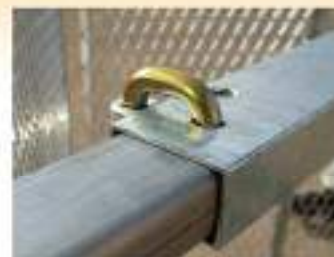
①:筋交部ストッパー