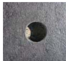
連結用・吊元用穴 (φ25mm)