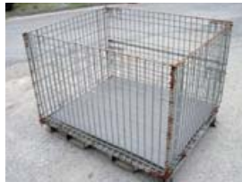
コンテナなどの敷板