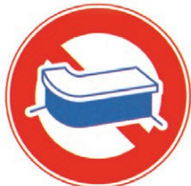
カウンター・床面