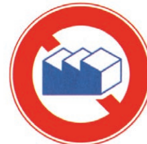
プラント・設備類 (耐油・耐溶剤性必要な場合)