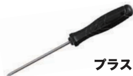
プラスドライバー