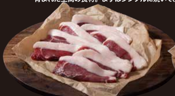
猪肉 猪ももスライス(冷凍パック) 100g 650円(税込702円)

さっぱりとした中でも、旨味を強く感じるイノシシの肉は、自然の中で 育まれた至高の食材。まずはシンプルに焼いて、塩でご堪能ください。