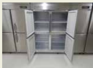
大容量の冷凍庫にて保管。 安定した供給が可能に。