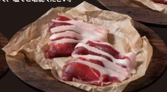
猪肉 ばらスライス (冷凍パック) 100g 750円(税込810円) 猪肉 ローススライス (冷凍パック) 100g 750円(税込810円) 猪肉 肩ローススライス (冷凍パック) 100g 750円(税込810円)