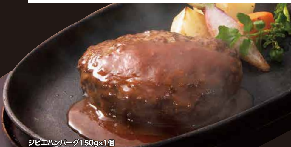
ジビエハンバーグ150g×1個

切ると中から肉汁が溢れるくらいジューシーです。上質な脂は、まったくしつこく無く旨み強い味わいです。