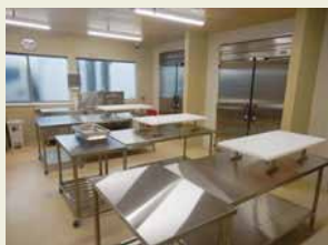
加工室 行政基準から、更に厳格な社内 基準を設定したクリーンルーム