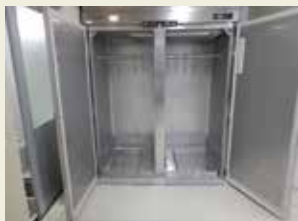
前室～加工室への カーテン冷蔵庫