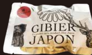
レトルト猪ハンバーグ 150g×1個 580円 (税込626円)

切ると中から肉汁が溢れるくらいジューシーです。上質な脂は、まったくしつこく無く旨み強い味わいです。