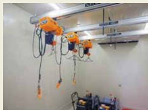
解体室 オゾン空調・オゾン水使用 95度温水にて雑菌繁殖を軽減

ドリーマーズ株式会社・株式会社竹りんが提携し、高品質な商品を安定供給いたします。 不規則な供給にて、現在まで浸透しなかった日本のジビエが、いよいよ世界レベルへ。