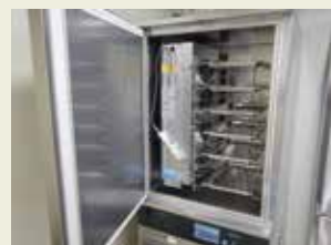
2020年時点での 最新急速冷凍機設置