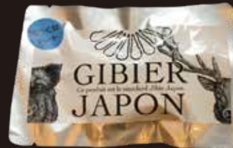
レトルト猪つくね 50g×2本 550円(税込594円)

ブレンドされている玉ねぎや山芋などの旨みがあり、甘 辛タレと肉汁が美味しい一品です。