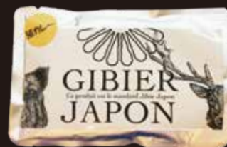
レトルト猪カレー 600円 (税込648円)

人気NO.1の定番カレーには、ゴロゴロとした肉が入り、濃厚な うまみが広がります。丁度良い中辛に仕上げました。