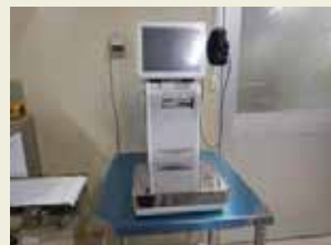
捕獲場所・時間も印字する、 計り付きラベルプリンター

現在イノシシでは、月100頭のペースで捕獲。最先端の設備とシステムで、高品質な商品を、通年安定供給する事が可能になりました。