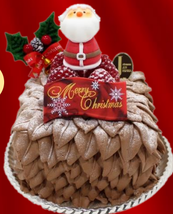
ノエルシャンティショコラ

約 W12×D11.5cm ¥3,800(税込) ベルギー産のショコラを使用した 生チョコクリームたっぷりのショートケーキ