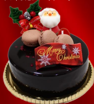
ノエルパリマッチ

直径約 12cm ¥5,000(税込) シェフのスペシャルテ フランス産チョコレートを使用したムースと ヘーゼルナッツのクリームの組み合わせ グラッサージュをかけたクリスマス限定デコレーション