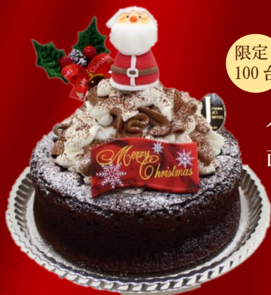
ノエルクラシックショコラ

直径約 14cm ¥4,800(税込) ドイツ産のショコラを使用して焼き上げた 濃厚なチョコレートケーキ