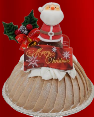
ノエルモンテビアンコ

直径約 12cm ¥4,800(税込) 十勝限定 50%の生クリーム、フランス産の 栗を使用したクリーミーで濃厚なクリスマス だけの特別なモンブラン