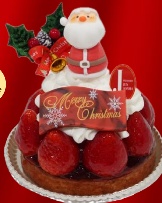
ノエルいちごのタルト

直径約 12cm ¥4,700(税込) サクサクのタルト台に厳選した苺のをせた クリスマス限定のいちごのタルト