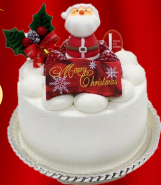
ノエルフルーツショート

直径約 12cm ¥4,200(税込) クリスマス限定の生クリームでたっぷりのフルーツ (黄桃・洋梨・オレンジ)をサンドした 特別なショートケーキ