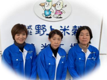
パートのみなさん