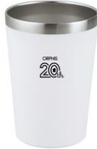
真空二重構造ステンレストンブラー