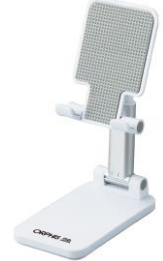
可動式モバイルスタンド

※1社様につき一点となります。※数に限りがあるため、ご希望に添えない場合がございます。また、記念品の内容が変わる場合がございます。