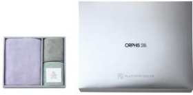
フェイスタオル+ミニタオル2Pセット

ご来場の記念に下記の中からご希望の品をおひとつプレゼントいたします。 下記の「 ご来場予約申込書 」に必要事項をご記入のうえ、FAXにてご返信ください。