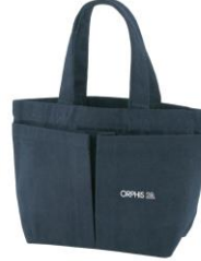
リサイクルデニム2ポケットトートバッグ