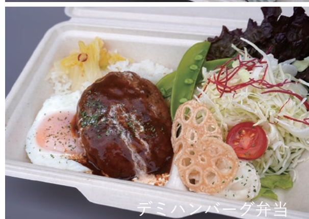
デミハンバーグ弁当