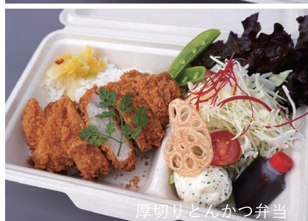
厚切りとんかつ弁当