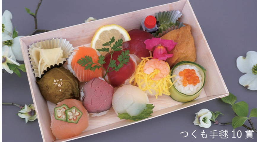
つくも手毬 10 貫