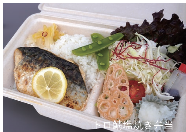
トロ鯖塩焼き弁当