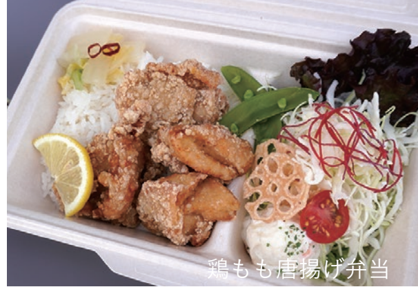
鶏もも唐揚げ弁当