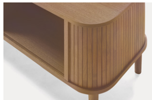
大きなRの天丸デザイン フラッシュ天板