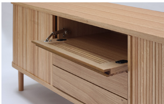
AV機器が使いやすいフラップ扉 フラッシュ天板