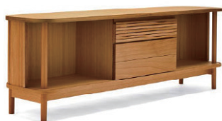
フラッシュ天板ブラックチェリー