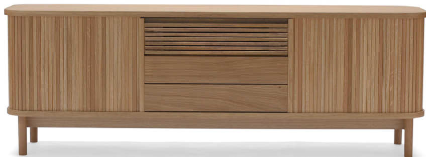
フラッシュ天板オーク

無垢の棒材を使い、独自の技術で美しく丈夫に仕上げたジャバラ扉。天板と底板に彫り込まれた溝をスライドして滑らかに開閉します。中央上部のフラップ扉は、リモコンの赤外線を通すためにルーバー仕様です。