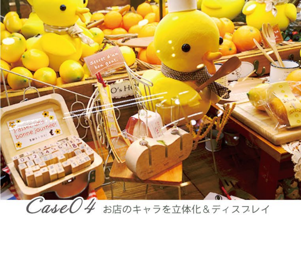
Case04 お店のキャラを立体化&ディスプレイ