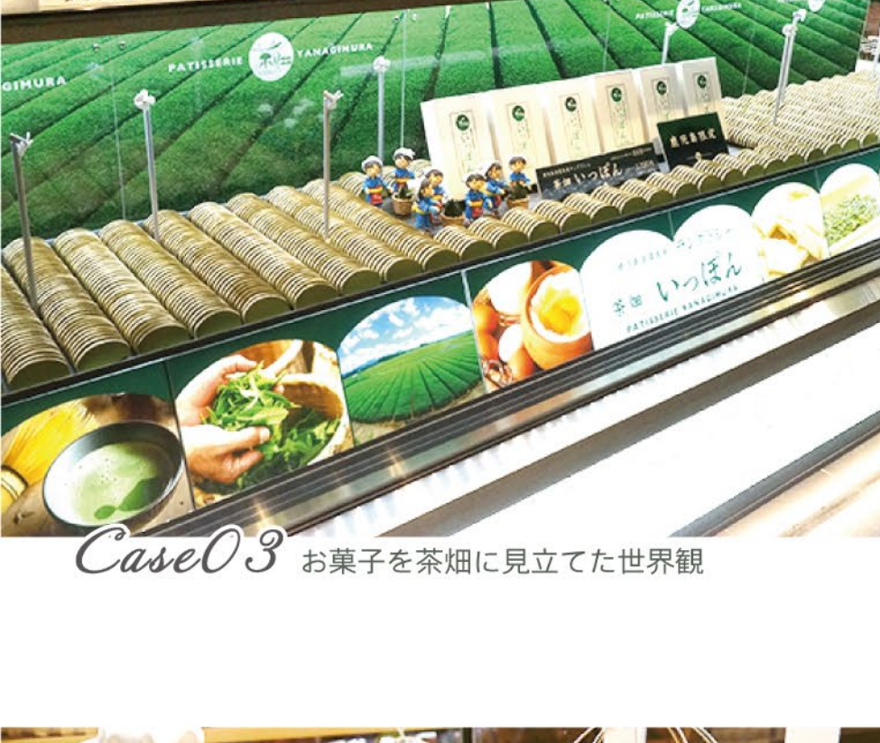
Case03 お菓子を茶畑に見立てた世界観