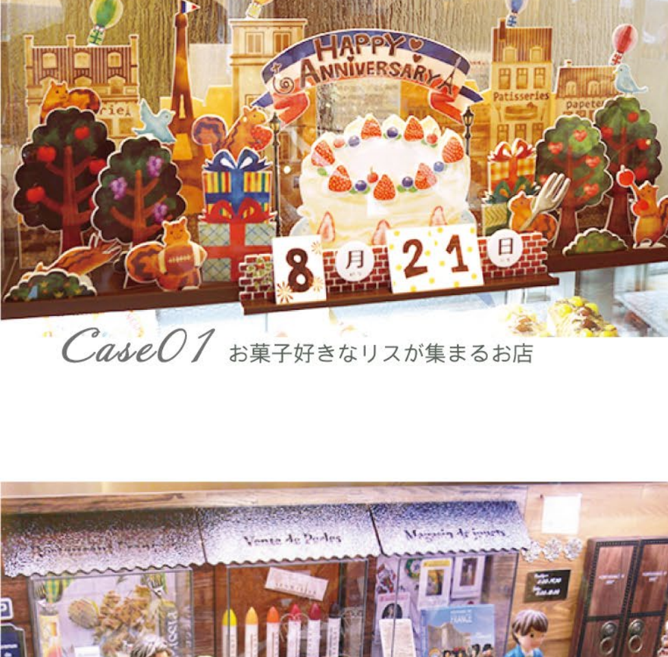
Case01 お菓子好きなリスが集まるお店