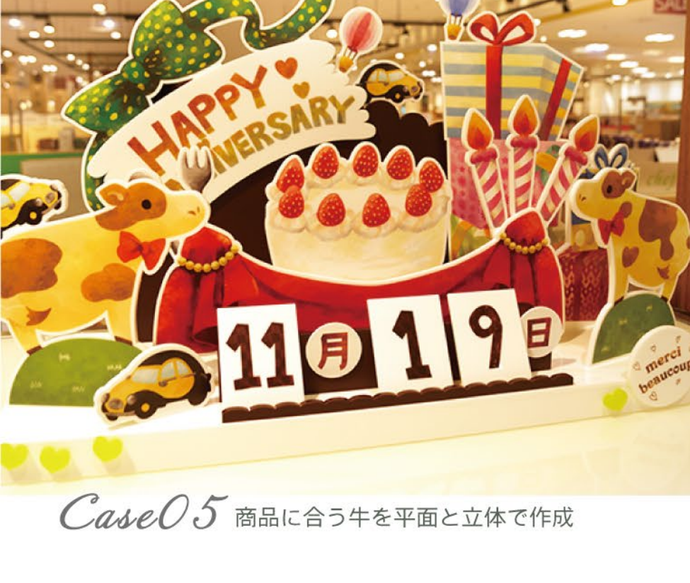
Case05 商品に合う牛を平面と立体で作成