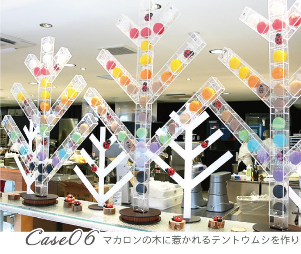
Case06 マカロンの木に惹かれるテントウムシを作りました