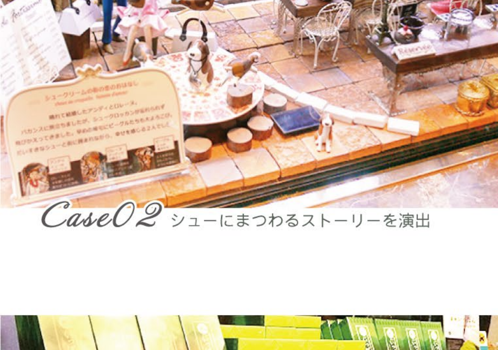
Case02 シューにまつわるストーリーを演出