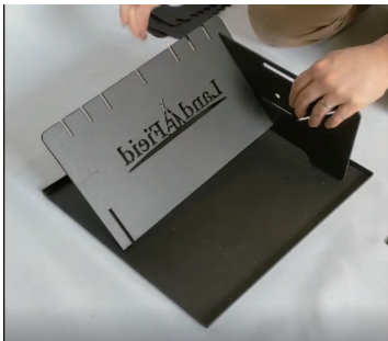
①上図のように組み合わせます。