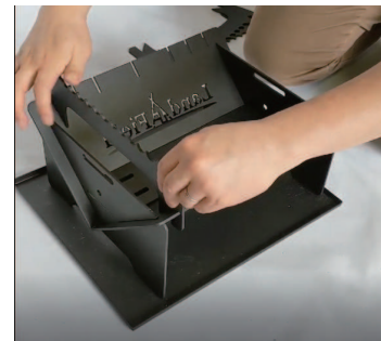
⑤ 最後にゴトクを取り付けます。