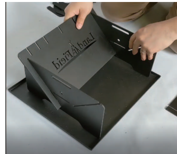
②上図のように取り付けます。