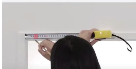
天井付け 窓枠の内側に取付ける方法