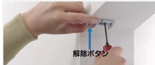
天井付け 解除ボタン：室内側（手前）