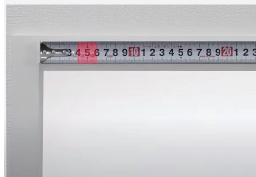
天井付け 窓枠の内側に取付ける方法

2 取付け面に印を付けます。ブラケットが3個以上の場合はその間が等間隔になるように取付けてください。