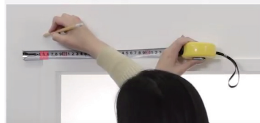
正面付け 窓枠の外側や壁面に取付ける方法