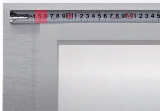
正面付け 窓枠の外側や壁面に取付ける方法

2 取付け面に印を付けます。ブラケットが 3 個以上の場合はその間が等間隔になるように取付けてください。