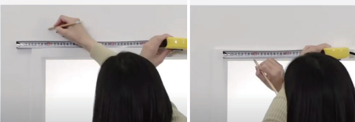
正面付け 窓枠の外側や壁面に取付ける方法 天井付け 窓枠の内側に取付ける方法