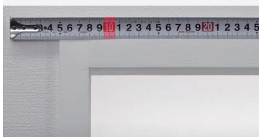
天井付け 窓枠の内側に取付ける方法