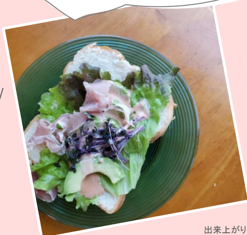
出来上がリイメー