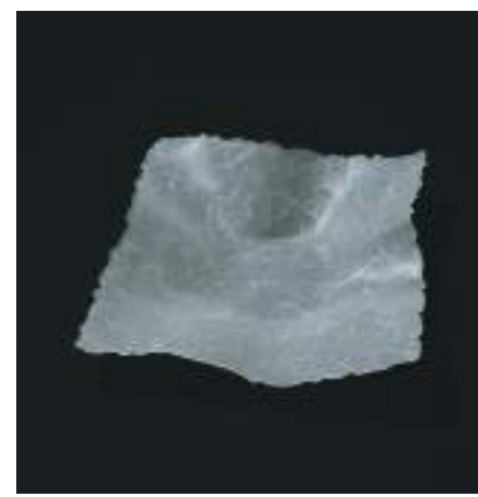
W240×D240×H65mm / 155g