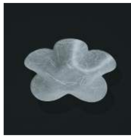
W260×D260×H50mm / 135g