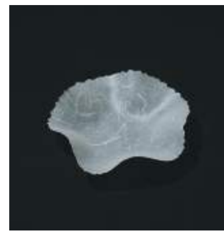
W235×D235×H55mm / 123g