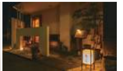
料理 / 名古屋 花見小路