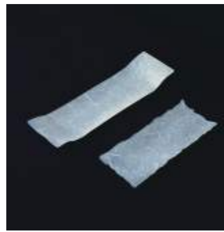
大・W340×D100×H25mm / 86g 小・W245×D100×H10mm / 59.5g