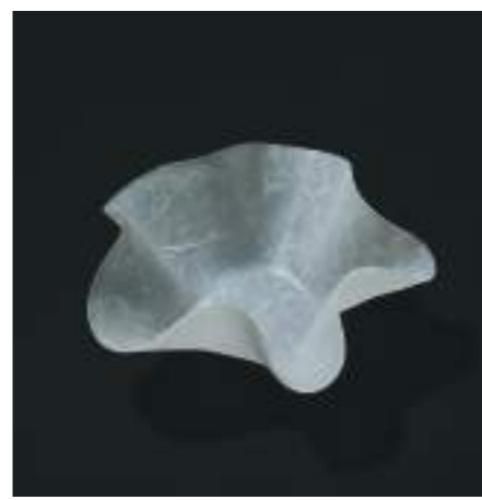
W250×D250×H100mm / 178g