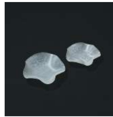
大・W140×D140×H40mm / 43g 小・W120×D120×H38mm / 33g