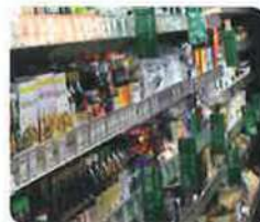
東京店 東京都港区北青山3-8-15

クレヨンハウス「野菜市場」では、オーガニックフーズ普及協会がお届けするすべての商品を、ご覧になり、購入することができます。