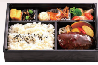
⑤デミグラスソース ハンバーグ弁当 ¥1500(税込)