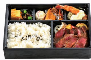
⑧ステーキ御膳 ¥4000(税込)