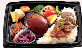
④ハンバーグ &国産牛カルビ弁当 ¥1280(税込)