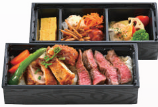
⑦チキンステーキ &鹿児島黒牛ステーキ弁当 ¥2500(税込)