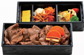
⑥すき焼き風弁当 ¥2000(税込)