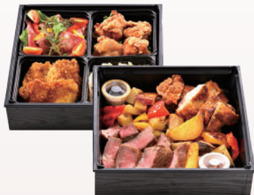
⑨高島屋のオードブル (約4人前) ¥5400(税込)