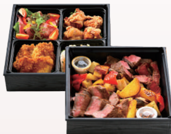
⑩鹿児島黒牛 ご堪能オードブル (約4人前) ¥8640(税込)