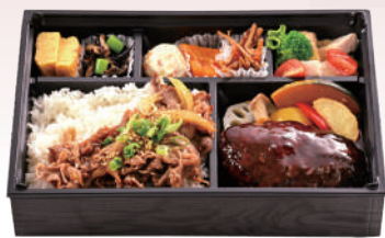
①ハンバーグ &焼きしゃぶ弁当 ¥1800(税込)