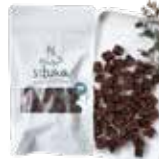
ころころ牛タン皮 30g