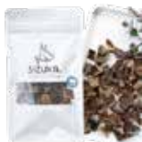
ひとくち牛タン皮 30g