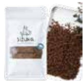
牛タン皮 ふりかけ 30g