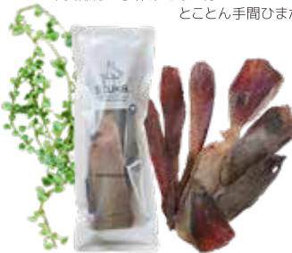
牛タン皮 スライスジャーキー 80g

不要部分を手作業で取り除き、アクとり、手こねするなどことん手間ひまかけて作っています。